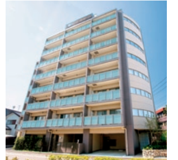
グランフォーレ北綾瀬（東京都足立区）

当期（平成21年1月期）の配当につきましては、経常利益の状況と安定的な配当実施の方針を踏まえ、1株当たり年間配当金1,000円とさせていただきます。