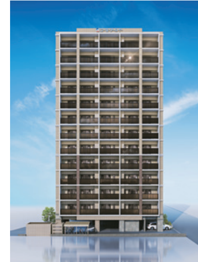
資産運用型マンション グランフォーレ博多駅プレミア (60戸) 2020年6月完成 福岡市博多区