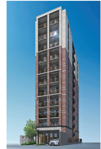
ファミリーマンション グランフォーレ西新パサージュ (39戸) 2021年11月完成予定 福岡市早良区