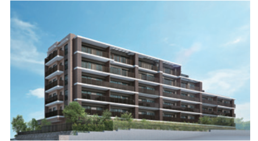
(グランフォーレ平尾四丁目レジデンス)

当社グループは、ファミリーマンション及び資産運用型マンションの販売を継続して行うとともに、新規物件の開発に取り組みました。この結果、売上高9,375,168千円（前期比3.5%増）、営業利益754,281千円（前期比20.8%増）、経常利益839,738千円（前期比30.5%増）、親会社株主に帰属する当期純利益580,720千円（前期比36.4%増）となりました。