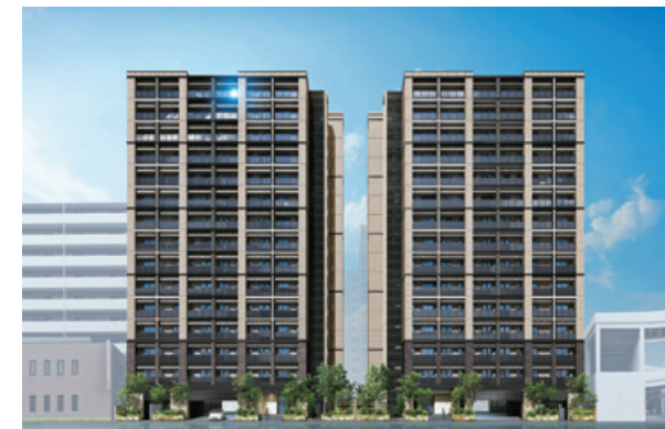
資産運用型マンション グランフォーレ千早マークスクエア イーストウイング (252戸) 2020年11月完成 福岡市東区