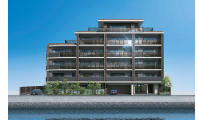
ファミリーマンション グランフォーレ百道アクアフロント (18戸) 2020年10月完成 福岡市早良区